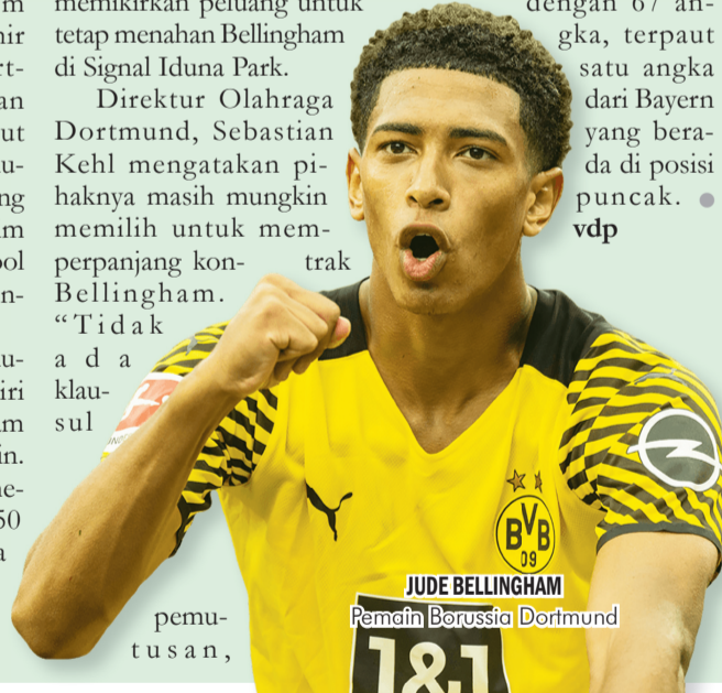
JUDE BELLINGHAM Pemain Borussia Dortmund

Dortmund saat ini masih bersaing dengan Bayern Munich dalam perebutan gelar Liga Jerman. Die Borussen di urutan kedua klasemen dengan 67 angka, terpaut satu angka dari Bayern yang berada di posisi puncak. ● vdp