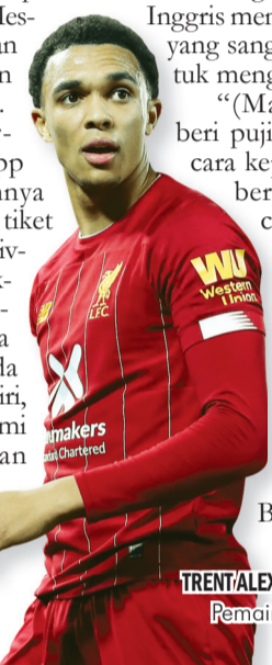
TRENT ALEXANDER-ARNOLD Pemain Liverpool

"(Manajer) memberi pujian. Dia berbicara kepada kami dan berkata mari kita coba lagi. Sudah lama. Saya pikir kami mengujutkannya. Itu adalah gol yang bekerja dengan baik," ungkap Alexander-Arnold dikutip dari BBC. ● vdp