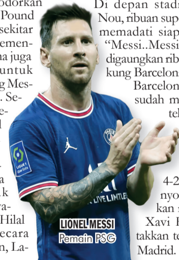
LIONEL MESSI Pemain PS&C

Barcelona memang sudah mengunci tiket juara Liga Spanyol di pekan ke-34. Kemenangan 4-2 atas Espanyol memastikan raih poin Xavi Hernandez takkan terkejar Real Madrid. ● vit